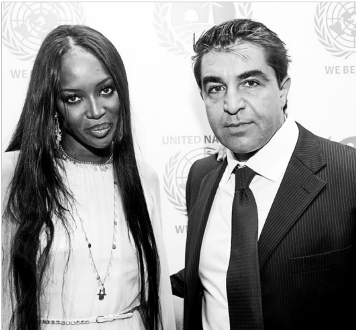
La top model Naomi Campbell con Zampolli en un acto de Naciones Unidas